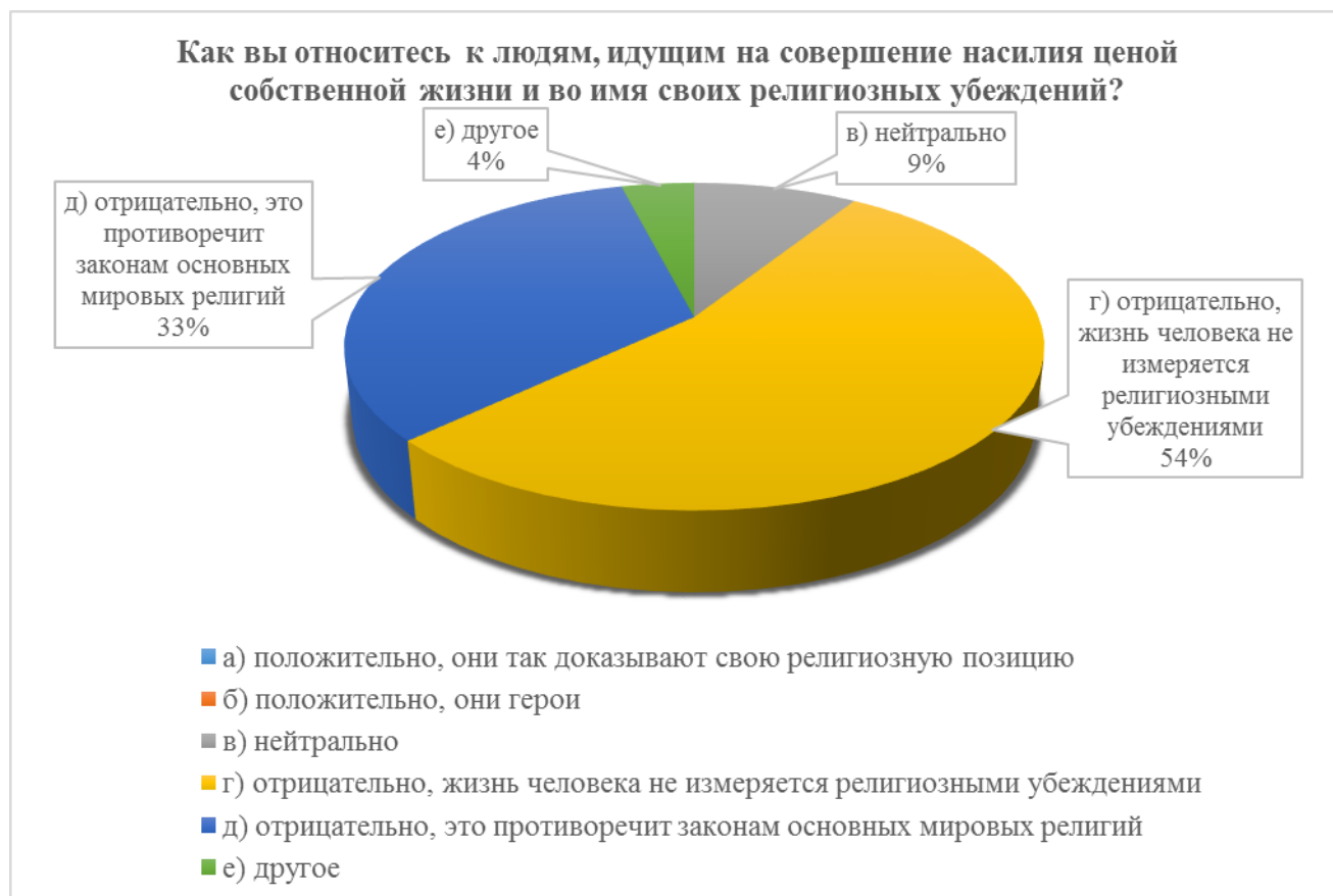
Рисунок 4 – Отношение респондентов к террористам-смертникам

Последним был вопрос о том, насколько согласны респонденты с предложенными утверждениями для того, чтобы также иметь представление о мнении школьников и студентов по данному вопросу, а также выявить процент молодых людей, которые поддерживают или частично поддерживают проявление насилия для продвижения идей своей веры. Данные в процентах указаны в таблице 1.