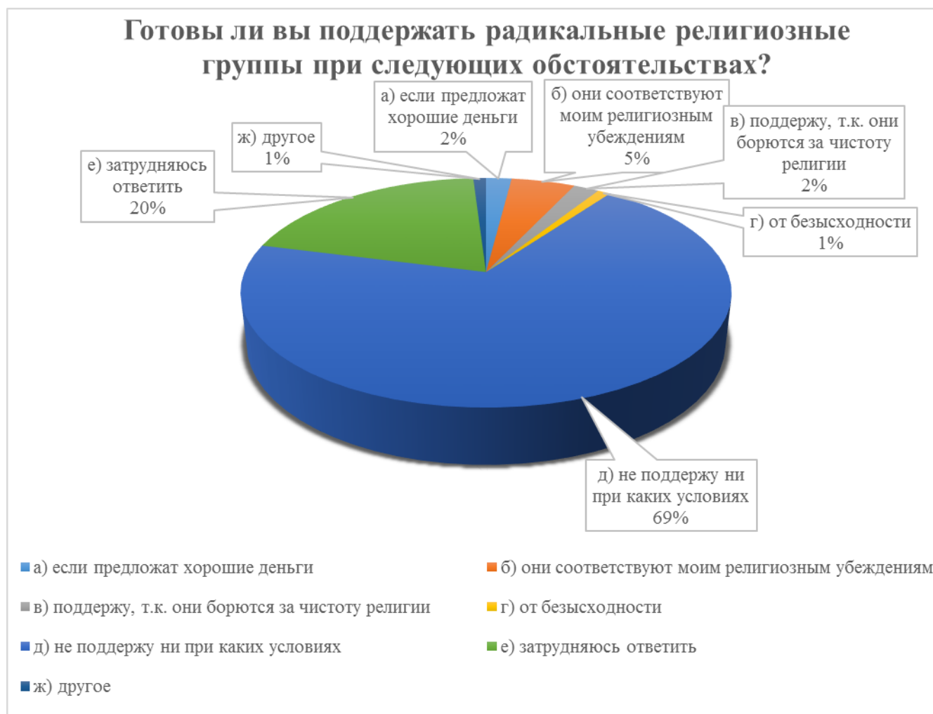
Рисунок 3 – Условия, при которых респондент готов поддержать радикальные религиозные группы.

поддержат ни при каких условиях подобное явление, 20% затруднились ответить на поставленный вопрос, 5% считают, что если такие группы соответствуют их религиозным взглядам, то можно их поддержать, 4% разделились между мнениями, что такие объединения поддерживают чистоту религии либо заслуживают поддержки при условии предложения хороших денег. Оставшиеся 2% разделились между поддержкой радикальных религиозных групп в условиях безысходности и «другое» (где было указано, что респондент готов поддержать данные группы при условии угрозы их жизни). Данные по вопросу представлены на рисунке 3