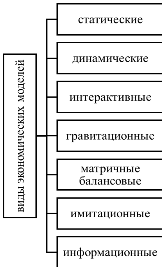
Рисунок 2. — Виды экономических моделей

На рисунке 2 отображены основные виды экономических моделей, применяемых на сегодняшний день.