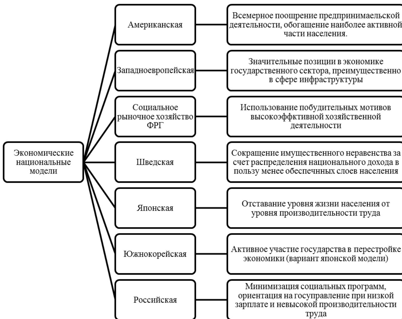
Рисунок 1. — Экономические национальные модели