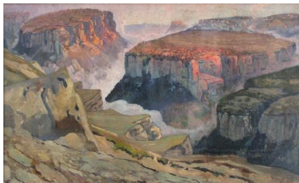
Иллюстрация 2. — В горах близ Чуфут-Кале. Холст, масло. Алушкинский государственный дворцово-парковый музей-заповедник.