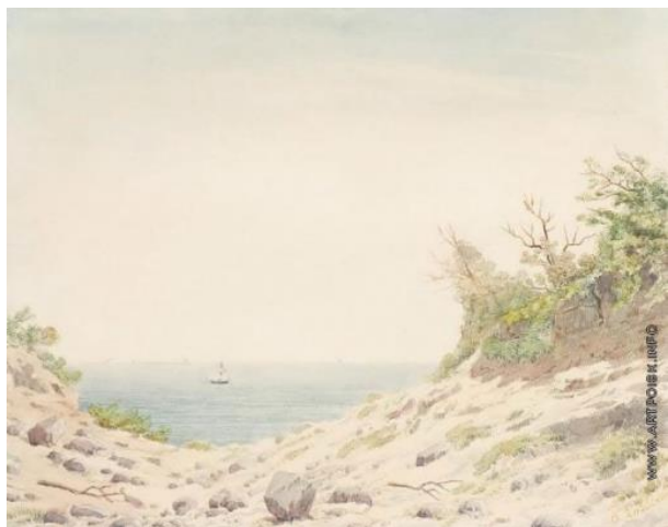
Иллюстрация 1. — Крымский пейзаж. 1910-е. Картон, акварель. Частная коллекция