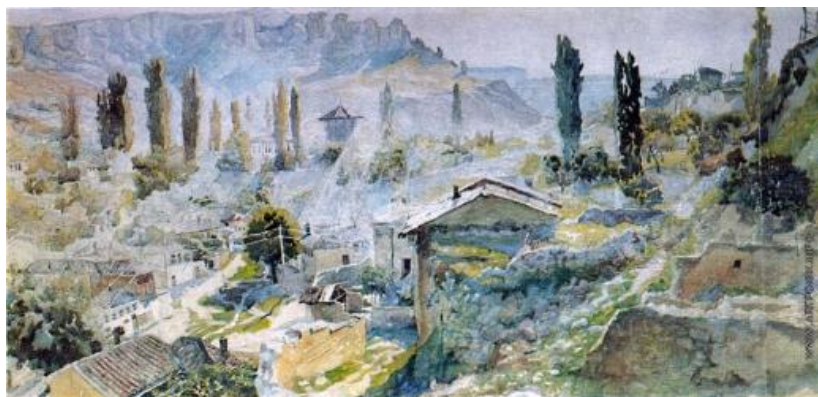
Иллюстрация 3. — Утро в Бахчисарае. Бумага, акварель. Симферопольский художественный музей