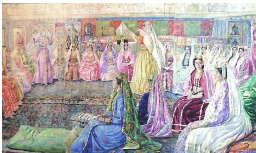
Иллюстрация 4. — Крымско-татарская свадьба (Триптих). Бумага, акварель Художественный музей Бахчисарайского историко-культурного заповедника.